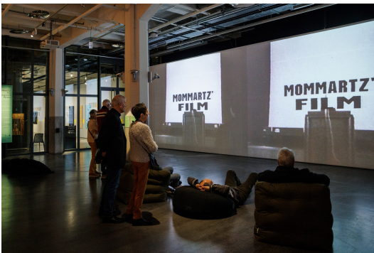
Impressionen der Ausstellungseröffnung »Lutz Mommartz. Der durchsichtige Mensch« im ZKM | Zentrum für Kunst und Medien Karlsruhe, 2023.