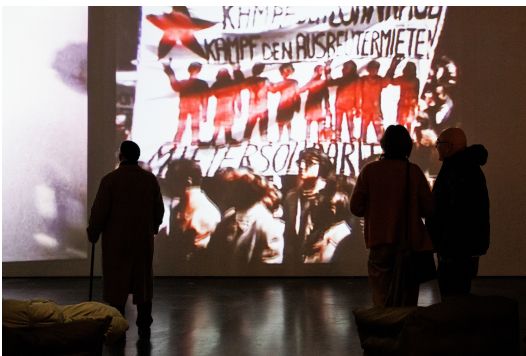
Impressionen der Ausstellungseröffnung »Lutz Mommartz. Der durchsichtige Mensch« im ZKM | Zentrum für Kunst und Medien Karlsruhe, 2023.