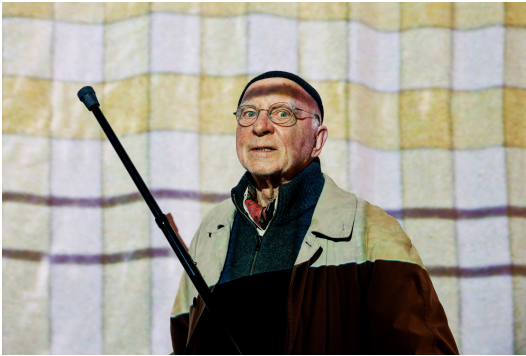
Lutz Mommartz im ZKM | Zentrum für Kunst und Medien Karlsruhe bei der Eröffnung von »Lutz Mommartz. Der durchsichtige Mensch«, 2023.