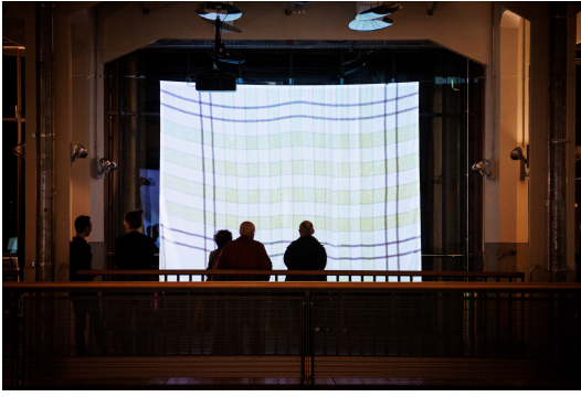
Impressionen der Ausstellungseröffnung »Lutz Mommartz. Der durchsichtige Mensch« im ZKM | Zentrum für Kunst und Medien Karlsruhe, 2023.