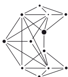
CHOREOGRAPHY OF SOUND

Die ARD Hörspieltage sind ein Gemeinschaftsprojekt von ARD und Deutschlandradio. Die organisatorische Federführung des Hörspielfestivals hat der Südwestrundfunk gemeinsam mit dem Hessischen Rundfunk. Die Partner, auch in der Programmgestaltung, sind wie in den vergangenen Jahren das Zentrum für Kunst und Medientechnologie Karlsruhe (ZKM), die Staatliche Hochschule für Gestaltung (HfG) und die Stadt Karlsruhe.