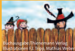
Buchausgabe: Thienemann Verlag Illustrationen F.J. Tripp, Mathias Weber

14.00 ■ Live-Musikhörspiel Der Räuber Hotzenplotz Ein Live-Musikhörspiel, basierend auf dem gleichnamigen Kinderbuch von Otfried Preußler. Der Räuber Hotzenplotz hat sich Großmutterns geliebte Kaffeemühle unter den Nagel gerissen. Wachtmeister Dimpfmoser nimmt alles zu Protokoll, und Kasperl und Seppel handeln umgehend: Sie wollen nicht nur die Mühle zurückbekommen, sondern Hotzenplotz kurzerhand selbst dingfest machen. Leider haben sie nicht damit gerechnet, dass dieser es faustdick hinter den Ohren hat. Die Schauspieler auf der Bühne werden begleitet von Twintett und weiteren Musikern, Max Bauer sorgt für überraschende Geräusche. | ab 6 Prod.: WDR/BR/hr/NDR/SWR/rbb/DKultur 2013 ☞ Nur mit kostenloser Einlasskarte HfG_Lichthof 4