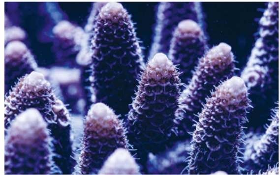
2-Kanal-Videoinstallation, Farbe, Ton, 25:40 Min.