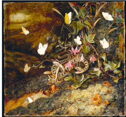
Gemälde, Öl auf Leinwand, 41,8 × 44,2 cm Staatliche Kunsthalle Karlsruhe

Otto Marseus van Schrieck war Experte für eine besondere Form der Stilllebenmalerei, die als Sottobosco bekannt ist: Ansichten des Waldbodens in Nahaufnahme, gewissermaßen aus der Perspektive einer Schnecke. Schriecks virtuose Porträts von – hauptsächlich – Pflanzen, Insekten, Reptilien und Amphibien, festgehalten in einem flackernden Chiaroscuro, zeigen Konflikte zwischen den Kreaturen – hier zwischen einer Schlange und Schmetterlingen. Diese kleinformatigen Auseinandersetzungen waren zugleich Naturschauspiele als dynamische Prozesse und Sinnbilder kosmischer Feindschaften zwischen Körper und Seele, Natur und Gegennatur, Laster und Tugend, und lösten damals wissenschaftliche Debatten aus. Es war Schrieck, der als erster beobachtete, dass die winzigen Fliegen, die seltsamerweise aus Schmetterlingspuppen krochen, aus den von parasitären Wespen gelegten Eiern geboren wurden. Diese Entdeckung widersprach den aristotelischen Theorien der Spontanzeugung, indem sie bewies, dass sich diese Insekten, wie alle Schöpfungen Gottes, „nach ihrer eigenen Art“ (Gen 1:11) fortpflanzten.